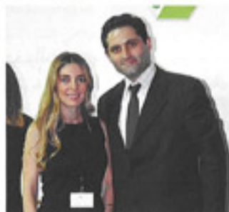
جونى مدور في جناح GREENSTONE