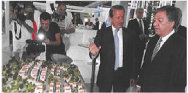
الوزير فريج صابونجيان يستمع الى شرح الياس سعد أمام جناح ESLA

افتتح وزير الصناعة فريج صابونجيان معرض DREAM 2012 العقاري في دورته الثالثة في مركز المعارض «بيال» والذي تنظمه شركة PROMOFAIR، في حضور شخصيات اقتصادية ومصرفية ورجال أعمال. وجال صابونجيان في أرجاء المعرض، ولشاد بجهود منظمته وفي مقدمهم مدير شركة PROMOFAIR شميل باز. وقال على هامش الجولة: إن السوق العقارية لا تزال واعدة لكن بحر، علما أننا شهدنا نموا جديدا بين العامين ٢٠٠٦ و ٢٠١١.